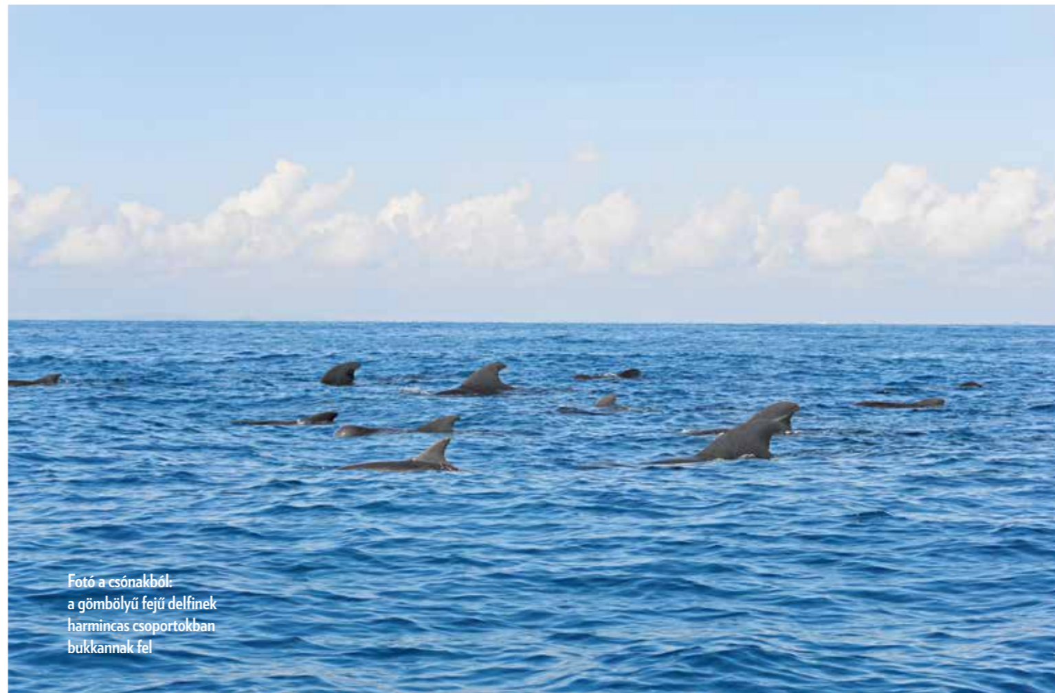
Fotó a csónakból: a gömbölyű fejű delfinek harmincas csoportokban bukkannak fel

Erről a partról indul a kishajó reggel hatkor a bálnaturára. Bő fél órán keresztül a parttal párhuzamosan lovagolunk a hullámokon, de amikor a kapitány elvétí a ritmust, akkorát koppán a műanyag motorcsónak a vízben, hogy a következő két és fél órában végig két kézzel kapaszkodunk. A nyílt tengerre érve először delfinek üdvözlök a korán kelőket, aztán a kapitány kiszúr a horizonton két páraoszlopot. „Kék bálna!” – kiáltja, és már szeljük is a habokat, amilyen gyorsan csak lehet. Mire odaérünk, ►►