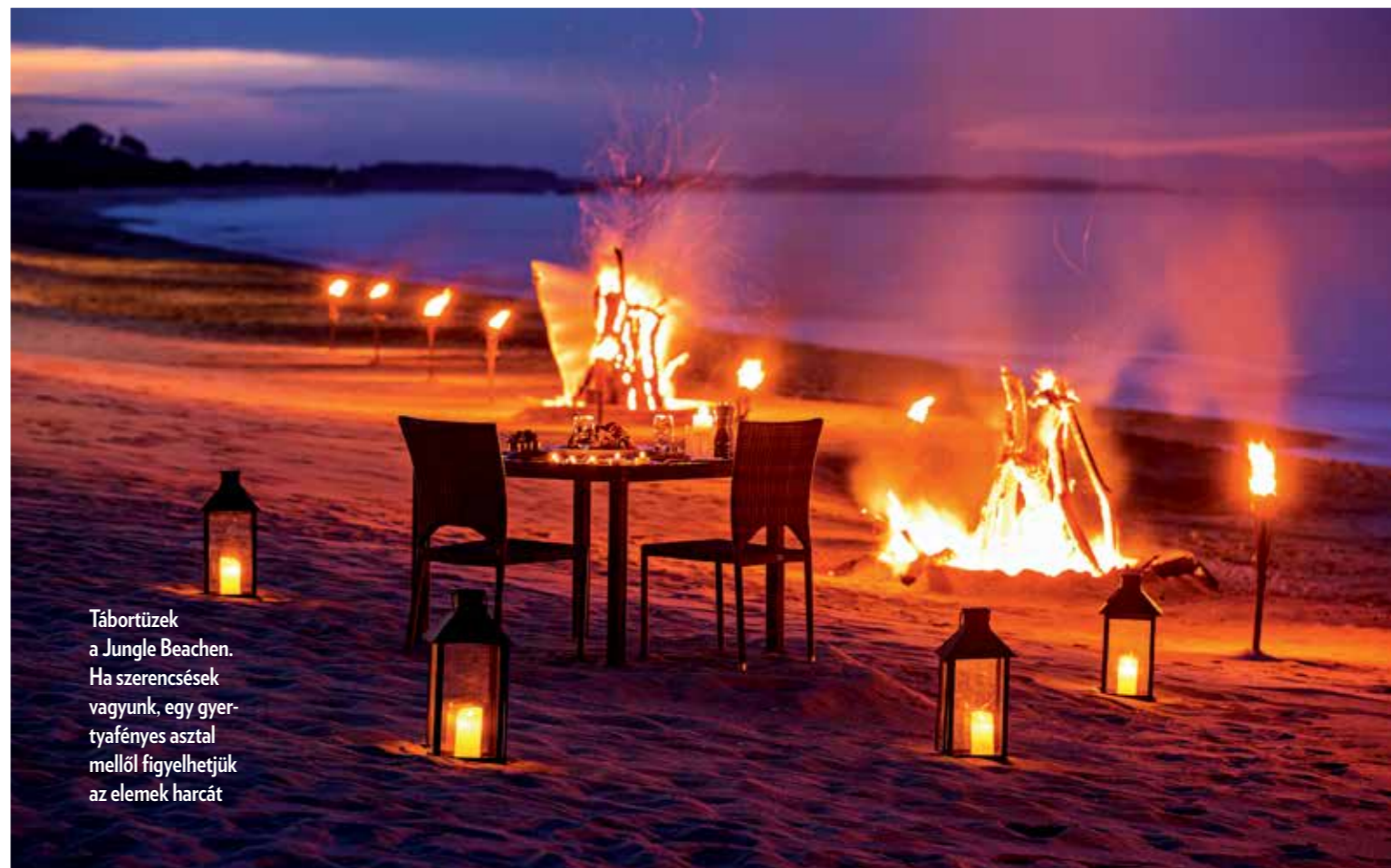
Tábortüzek a Jungle Beachen. Ha szerencsések vagyunk, egy gyertyafényes asztal mellől figyelhetjük az elemek harcát