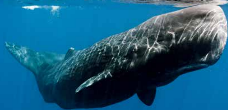
Ámbráscetekkel májustól nyár végéig lehet találkozni Trincomalee környékén