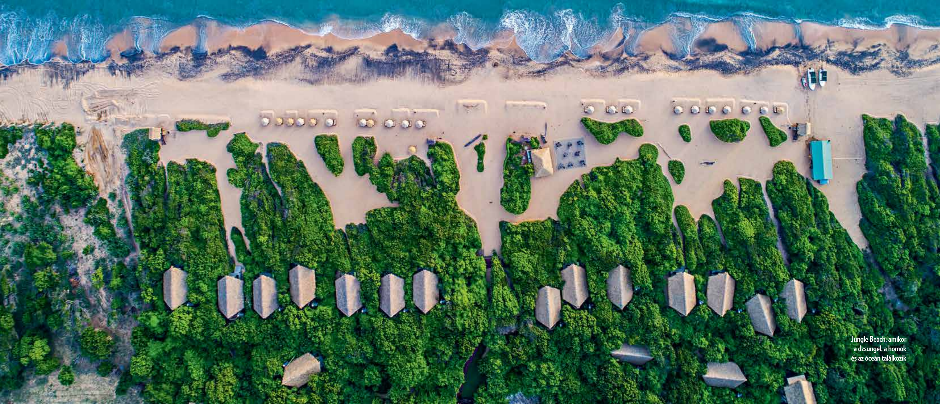
Jungle Beach: amikor a dzsungel, a homok és az óceán találkozik

Rengeteget zötykölődtek autóban, és kígyókat sejtettek a nyugágyuk feletti faágakon, de minden kényelmetlenséget elfelejtettek, amikor a csónakuk mellett végre megpillanthatták a világ legnagyobb állatát, a fenséges kék bálnát. A bálnanézés egy Srí Lanka-i nyaralás kötelező és lenyűgöző programja, de szerzőink, CSEKE ESZTER és S. TAKÁCS ANDRÁS még sok más miatt is szeretik az egzotikus szigetet.