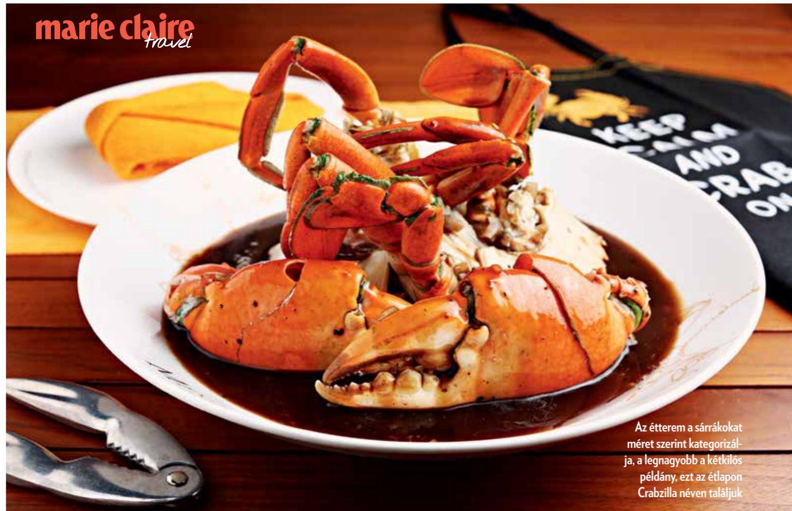
Az étterem a sárrákokat méret szerint kategorizálja, a legnagyobb a kétkilós példány, ezt az étlapon Crabzilla néven találjuk