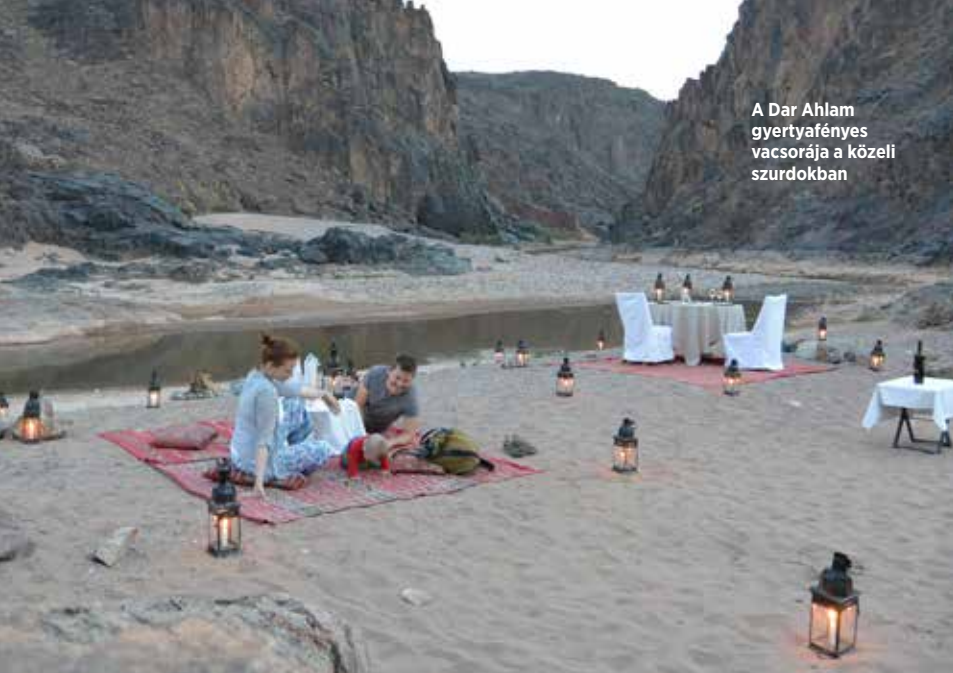
A Dar Ahlam gyertyafényes vacsorája a közeli szurdokban