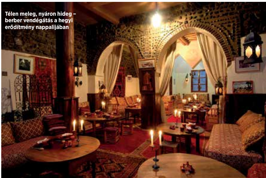
Télen meleg, nyáron hideg – berber vendégátás a hegyi erődítmény nappalijában