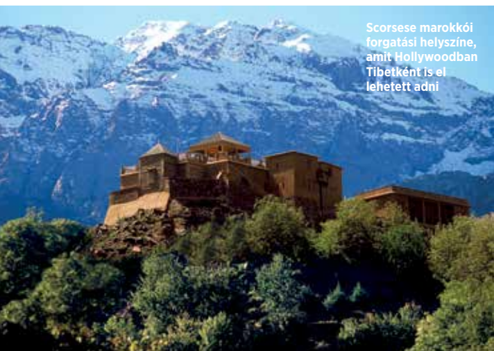
Scorsese marokkói forgatási helyszíne, amit Hollywoodban Tibetként is el lehetett adni