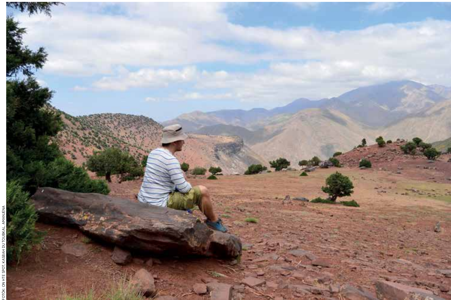
FOTÓK: ON HTE SPOT, KASBAH DU TOURBAKAL, AMANIJENA