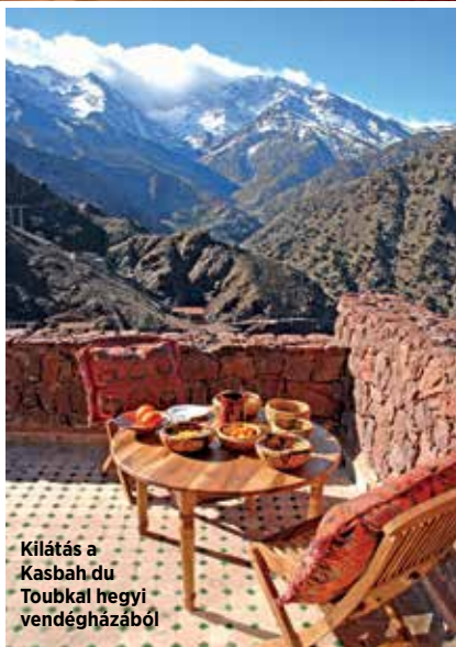
Kilátás a Kasbah du Toubkal hegyi vendégházából

bolják magukról a golyóálló mellényeket, és ne féljenek kinézni az ablakon, csak mert egy afrikai muszlim országban landoltak fél órával ezelőtt. Közben megszólal a müezzin, begördülünk a recepció elé, és belépünk az Ed Tuttle tervezte mór épületegyüttes varázslatos belső kertjébe, ahol egy több száz négyzetméteres díszmedencét két tucat vörös pavilon és hét, úgynevezett maison határol.