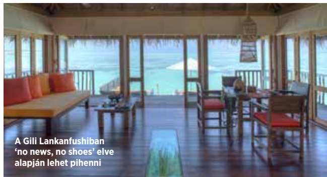
A Gili Lankanfushiban 'no news, no shoes' elve alapján lehet pihenni

Rá kell jönnünk, hogy ez nemcsak kor-szellem, a hely szelleme is. A lakberendezési és utazási magazinok címlapjaira kíváncsózó trendi villákban a kád közvetlenül a panorámaablak mellett kapott helyet, ahonnan a végtelen óceán tárulna elénk, ha nem pont fordítva tették volna be a kádat, úgy, hogy a fürdőszobai tv felé nézzen.