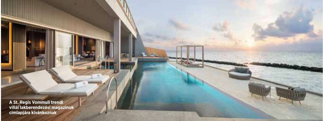
A St. Regis Vommuli trendi villái lakberendezési magazinok címlapjára kíváncsognak